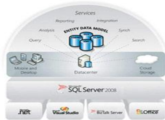
เว้น 1 บรรทัด

ภาพประกอบ 1 แสดงโครงสร้างแบบ service-oriented architecture (SOA) (ใช้ style Figure Caption)