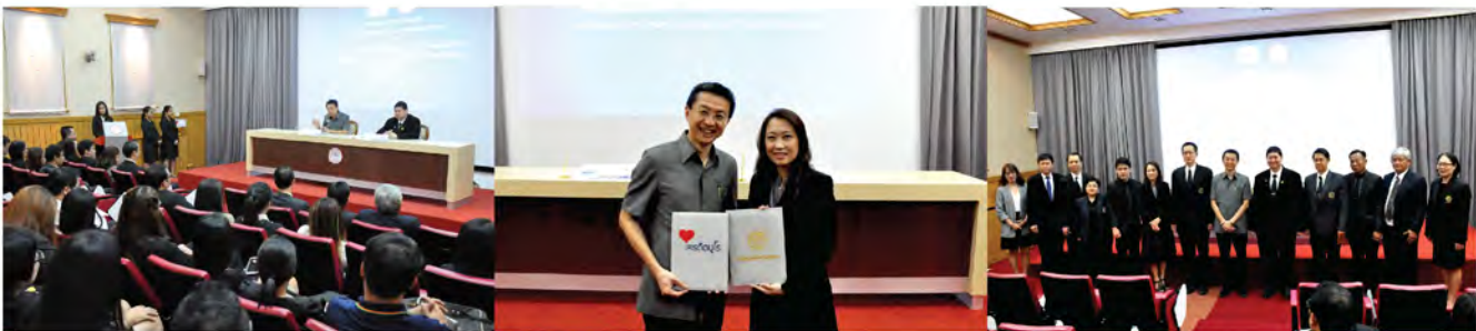
บรรยากาศพิธีลงนามบันทึกความร่วมมือ การจัดการผลงานทางวิชาการเผยแพร่ต่อสาธารณะ

บัณฑิตวิทยาลัย ได้จัดโครงการจัดทำและบริหารจัดการวิทยานิพนธ์ / สารนิพนธ์ ( i-Thesis ) สำหรับสถาบันอุดมศึกษา โดยมีคณาจารย์ นิสิตระดับบัณฑิตศึกษาที่ได้รับทุนการศึกษา i-Thesis และบุคลากร ภายในมหาวิทยาลัยเข้าร่วมซึ่งในการอบรมนั้นจะมีการบรรยาย ถึงขั้นตอนการถ่ายทอดความรู้ในการใช้งาน ระบบ i-Thesis เพื่อนำไปถ่ายทอดแก่นิสิตระดับบัณฑิตศึกษาในปีการศึกษา 2560 ต่อไป