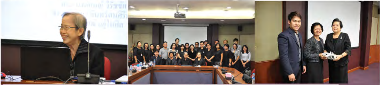
การอบรมการเขียนบทความวิจัยเพื่อตีพิมพ์ใน วารสารนานาชาติ วันที่ 8 กุมภาพันธ์ 2560 ณ อาคารบัณฑิตวิทยาลัย