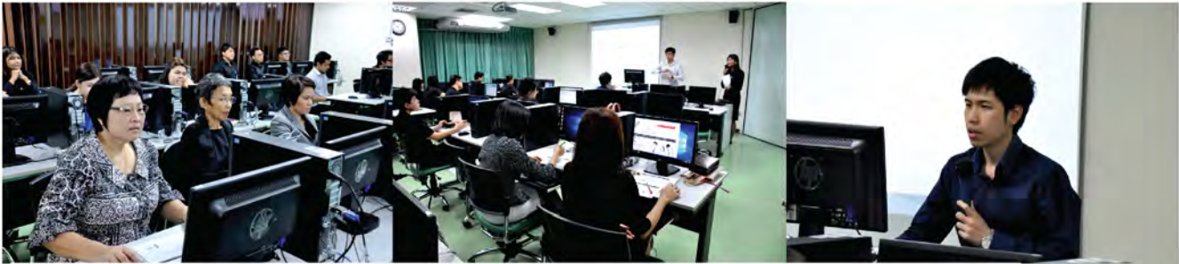
โครงการอบรมจัดทำและบริหารจัดการวิทยานิพนธ์ / สารนิพนธ์ วันที่ 10 มีนาคม 2560 ณ สำนักหอสมุดกลาง